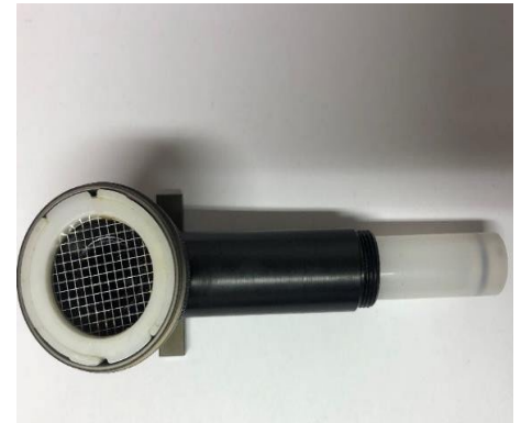
Figure 3 : GGP avec cartouche XAD-2

Pour l'analyse, un volume d'air défini de 210 l doit être aspiré à travers les filtres. Le prélèvement a été effectué sur un mélangeur de laboratoire de la marque InfraTest.