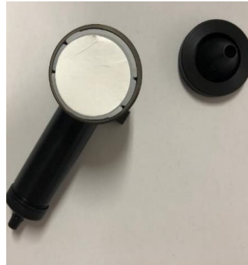
Figure 2 : GGP avec filtre en fibre de verre