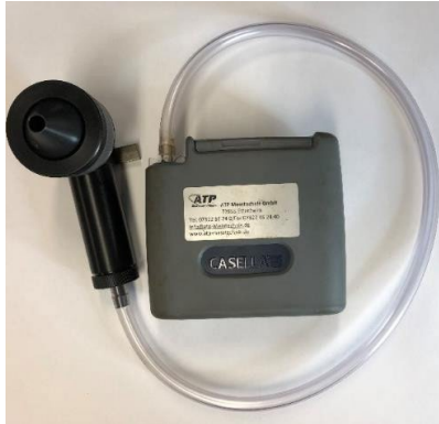
Figure 1 : GGP avec pompe adaptée